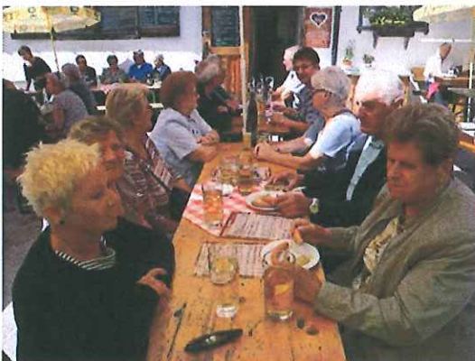
Christl-Alm am Trattberg