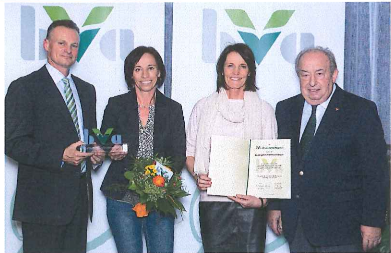
bVa-Gesundheitspreis für den Kindergarten Obersiebenbrunn für besondere Initiative und beispielhaftes Engagement im Bereich der Gesundheitsförderung Öff-

Auch heuer besuchte der Nikolaus die Kinder im Kindergarten und teilte seine Gaben an die Kinder aus, die sich über die Geschenke sehr freuten.