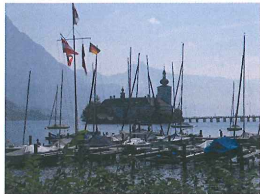
Gmunden Schloss Ort