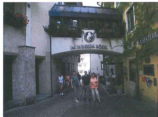
Wolfgangsee Weißes Rössl